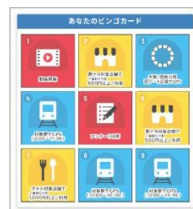
※ビンゴカードイメージ