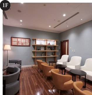
숙박객 전용 라운지