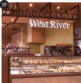
카페&amp;레스토랑 WEST RIVER 90°